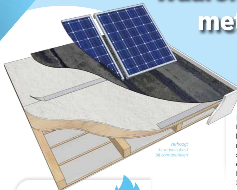
Verhoogt brandveiligheid bij zonnepanelen